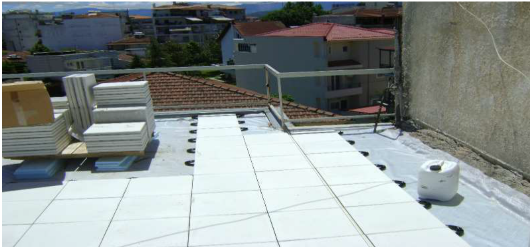
Εικόνα 3,4 – Διάταξη θερμομονωτικών πλακιδίων