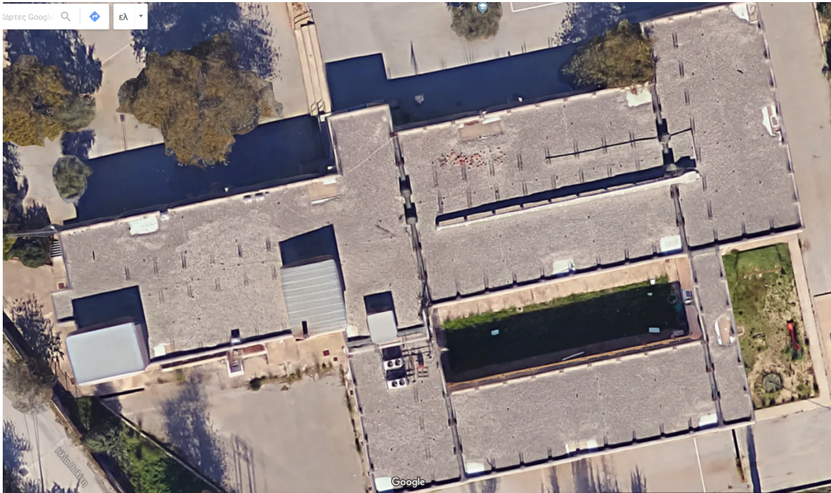
Εικόνα 1 – Κάτοψη του δώματος του Πειραματικού Δημοτικού σχολείου

Στις οικοδομικές εργασίες περιλαμβάνονται οι εργασίες τοποθέτησης θερμομονωτικών πλακιδίων πάνω από την υφιστάμενη υγρομόνωση.