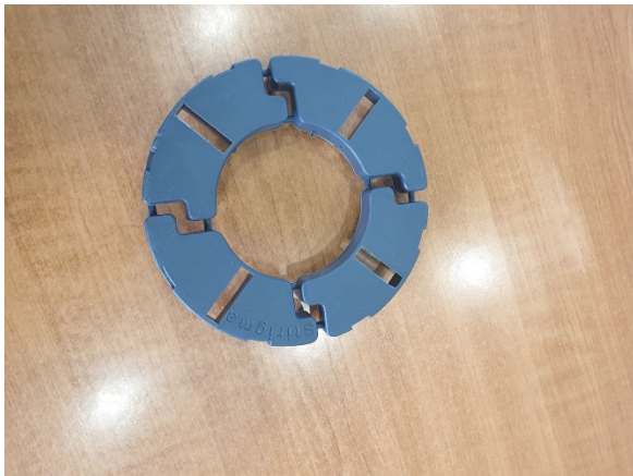
Εικόνα 2 – Στήριγμα πλακιδίων