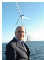
πρώην Υπουργός, πρώην Επίτροπος Ε.Ε.