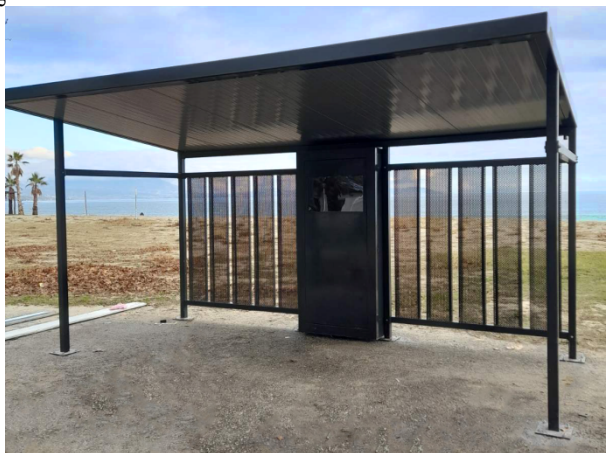
Ενδεικτική φωτογραφία 1

Θα πρέπει να κατασκευαστεί ένα στεγάστρο αλουμινίου ενδεικτικών διαστάσεων 5,00 m (Μ) x 3,00 m (Π) x 2,95 m (Υ), όπως φαίνεται στην ενδεικτική φωτογραφία 1. Στην βάση του στεγάστρου θα κατασκευαστεί βάση από σκυρόδεμα C20/25 με πλέγμα ελάχιστου πάχους 15εκ. (με κλίση για την απορροή των ομβρίων σύμφωνα με την επίβλεψη). Τα στεγάστρα υποχρεωτικά θα φέρουν στηρίγματα πάνω στα οποία θα τοποθετηθούν τα Φ/Β πλαίσια, τα οποία θα παράγουν την απαιτούμενη ενέργεια για την φόρτιση των ηλεκτρικών ποδηλάτων. Ταυτόχρονα το στεγάστρο θα χρησιμεύει και ως θέσεις στάθμευσης για 6 ηλεκτροκίνητα ποδήλατα στα οποία θα υπάρχει ειδική βάση στήριξης και ασφάλισης.