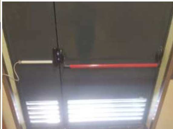
Φωτογραφία 2 : Υπάρχουσες μεταλλικές θύρες προς αντικατάσταση.