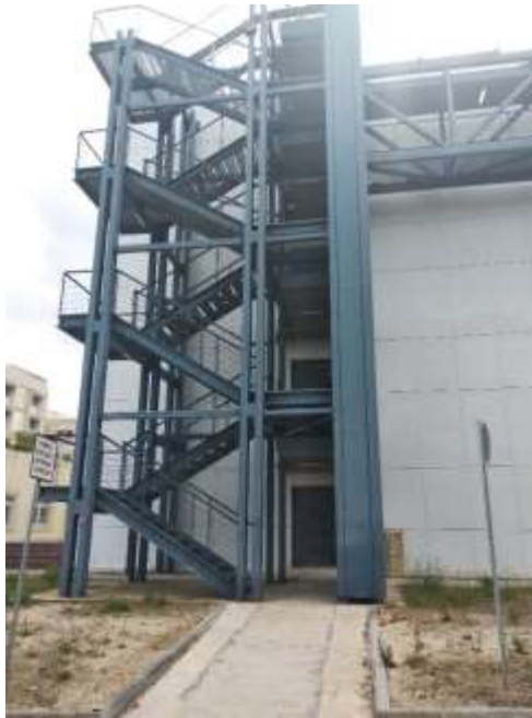
Φωτογραφία 1 : Θύρες στα μεταλλικά κλιμακοστάσια.