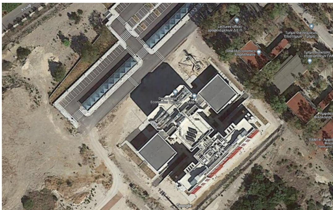
Εικόνα 1 - Υφιστάμενη κατάσταση του νέου κτιρίου Οικονομικού.

Στο νέο κτίριο του Οικονομικού τμήματος προβλέπεται να γίνουν οι απαραίτητες εργασίες της υπηρεσίας συντήρησης πρασίνου στον περιβάλλοντα χώρο του.