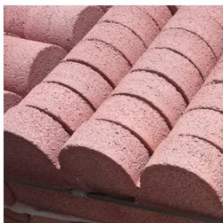
Εικόνα 3 - Έγχρωμα κράσπεδα με κούρμπα