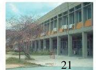
Άποψη του κτιρίου του Τμήματος Μηχανολόγων.

φιακά όλες τις υπηρεσίες και λειτουργίες του πανεπιστημίου. Σταθμός επεξεργασίας λιμμάτων, τα λύματα της πανεπιστημιούπολης υποβάλλονται σε επεξεργασία και μπορούν να χρησιμοποιηθούν στην άρδευση διαμορφωμένων χώρων πρασίνου. Ανακύκλωση. Ενεργειακή αναβάθμιση των υφιστάμενων κτιρίων. Συστήματα BMS (Building Management System). Εθελοντισμός. Μετεωρολογικός σταθμός και σταθμός αέριας ρύπανσης. Περιβαλλοντική εκπαίδευση και ευαισθητοποίηση.